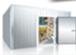
مخازن تبريد اللحوم والخبز