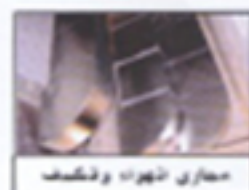
مخارج الهواء وتكييف