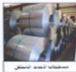
مسطحات صناعه سلك

تقدم «يونيكويل» منتجاتها بمختلف السماكات التغطية. وكافة درجات الجلفنة المتوفرة، وبكافة القياسات والأطوال التغطية، كما ولديها القدرة على تلبية الطلبات الخاصة سواء لمواسم المنتج النهائي أو لمعالجة تلافيفه بحسب الطلب.