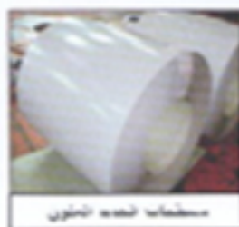
مسطحات صناعه سلك