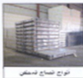
نوع صناعه سلك