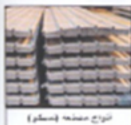
نوع صناعه (سلك)